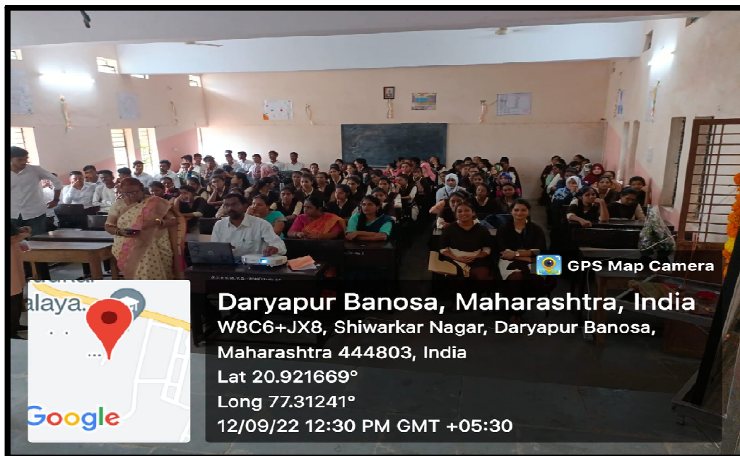
Students participated in workshop “We Save Wasudhara”