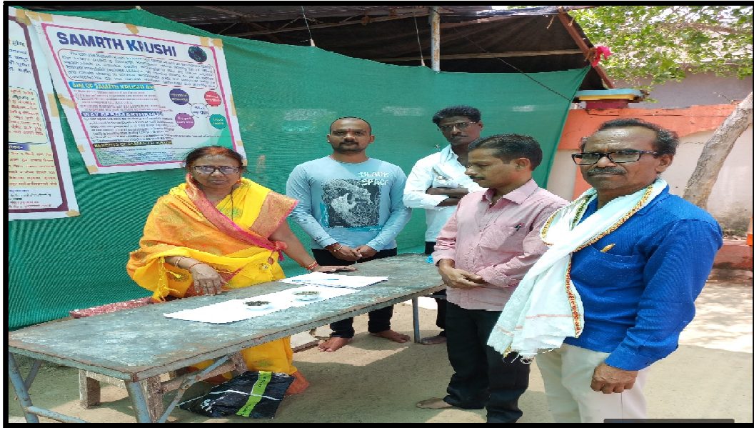
Workshop conducted in swami Samarth Seva Kedra Krushi Vibhag for farmer.